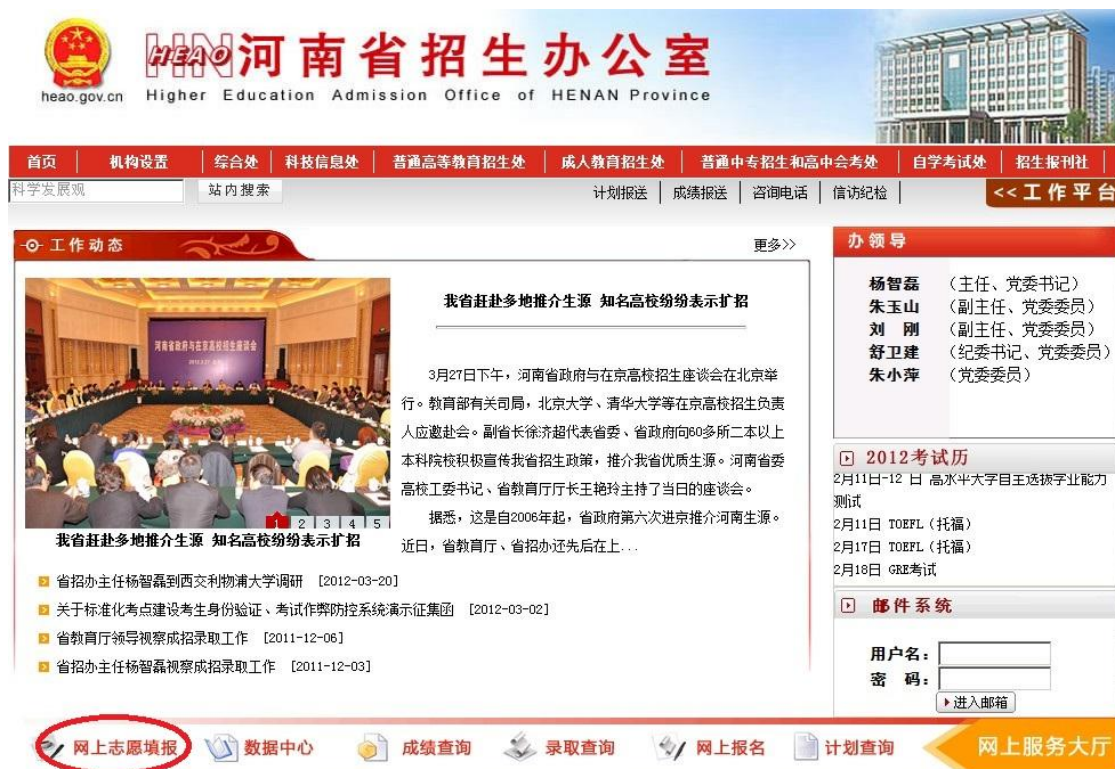
图2 河南省招生办公室首页-网上志愿填报链接

2、进入考生服务平台后，请仔细阅读“信息公告”区、“注意事项”区发布的政策公告和注意事项。