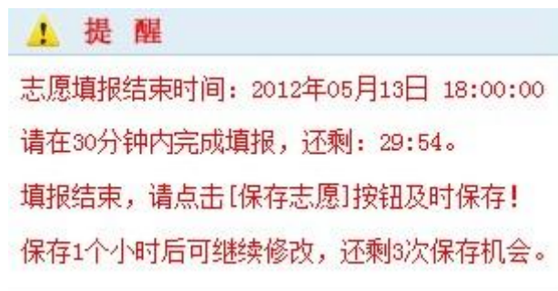
图 8 倒计时提醒

志愿填报必须在 30 分钟内完成。如果考生 30 分钟后还没有保存志愿信息，系统会提示考生是否保存志愿信息。倒计时提醒如下图所示：