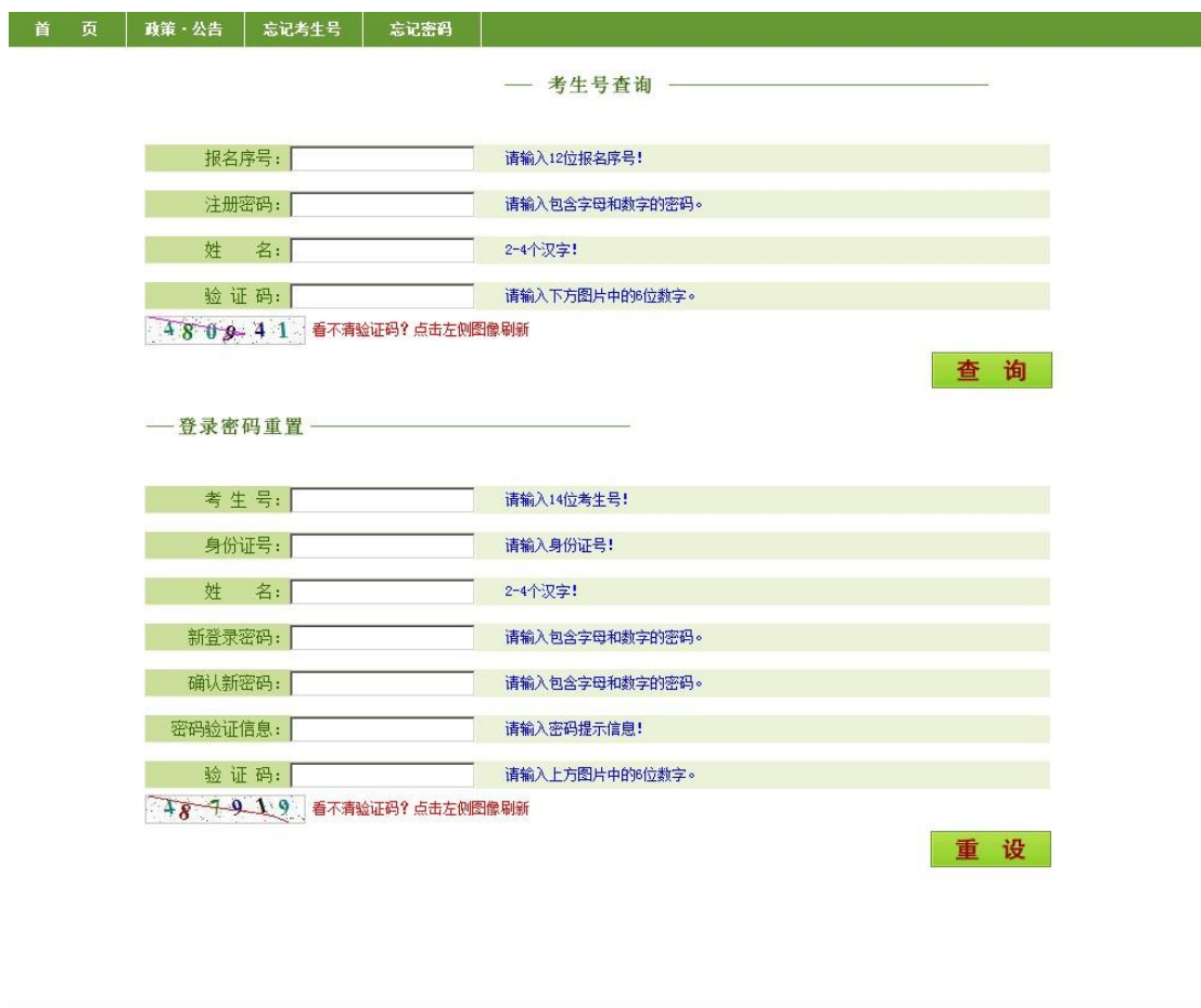
图 4 找回考生号和密码重置页面