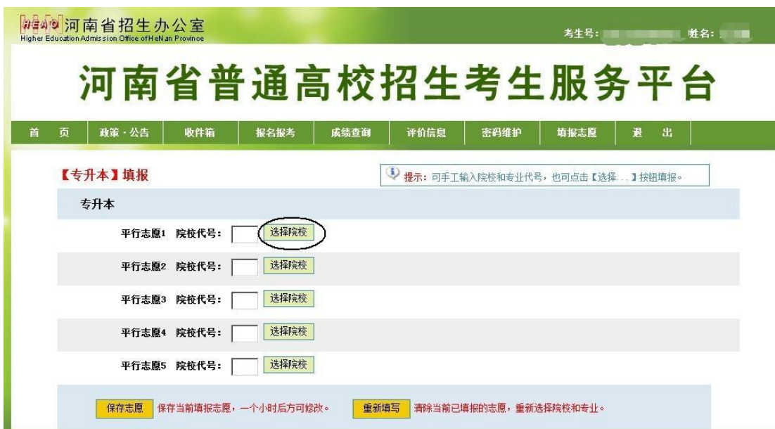
图 11 专升本志愿填报页面

计划查询具有智能筛选功能，自动显示符合相应条件的计划信息，如果信息比较多，请使用翻页功能或者输入页码直接跳转到相应的页。专升本志愿的界面如下：