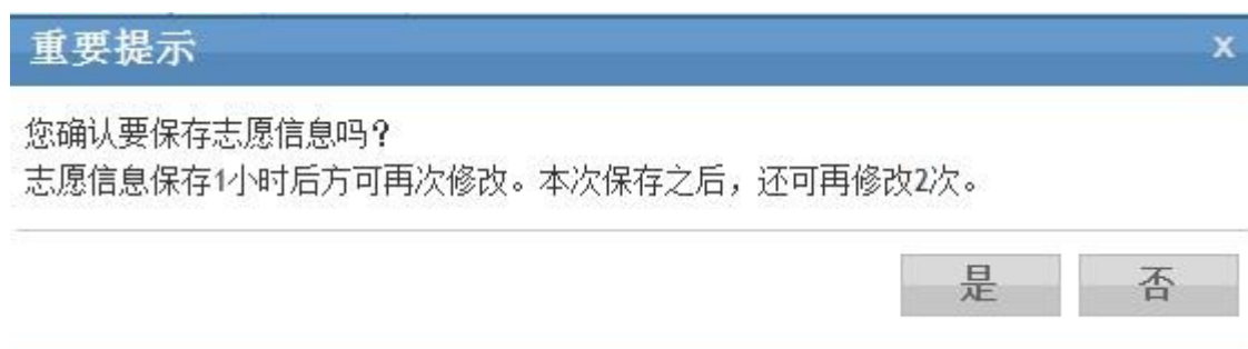
图 9 确认对话框

6、保存和重新填写志愿。考生如果确认自己填报的志愿信息无误后，点击志愿填报页面最下方的点击“保存志愿”按钮保存志愿信息。点击“保存志愿”后，系统会给出确认框。确认无误，点击“是”保存志愿，放弃保存点击“否”。